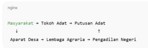
Gambar 2. Diagram Interaksi Hukum Adat dan Hukum Formal

diterapkan secara bersamaan dalam satu kasus sengketa.