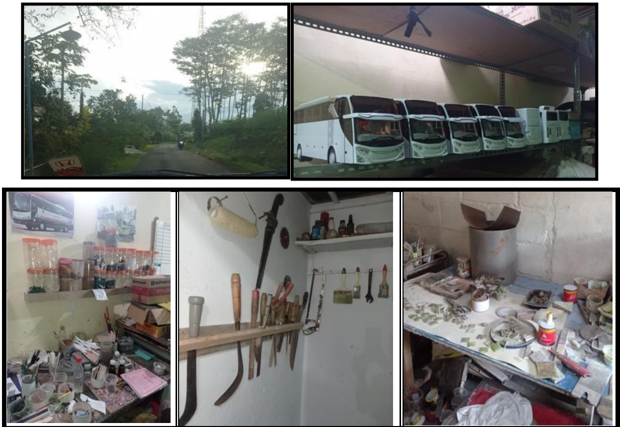
Gambar 3. Tahap Observasi meninjau UMKM

Program pengabdian masyarakat diawali dengan pengurusan ijin dan kordinasi dengan pemilik UMKM craft miniatur bis. Dengan pemiliknya bapak Syaiful menyebutkan bahwa adanya permasalahan tentang kurangnya pengetahuan dalam membuat laporan keuangan sehingga sulit untuk menata keuangan UMKM tersebut. Setelah tahap observasi dan pengamatan, kemudian pelaksanaan pelatihan dilaksanakan.