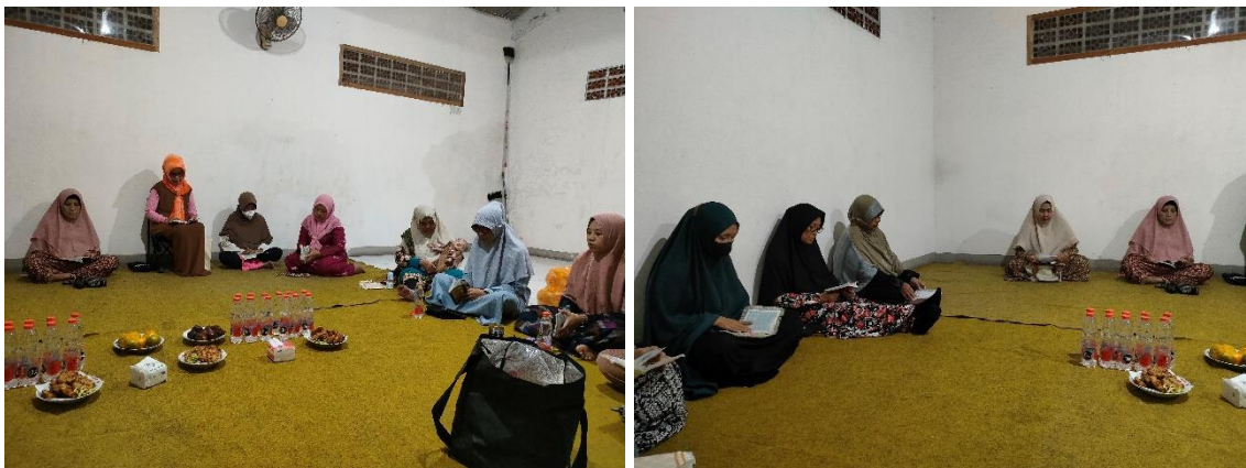
Gambar 2. Edukasi tahap akhir – edukasi pemahaman

Proses wawancara tersebut juga menemukan terlewatnya pengetahuan akan lingkup administrasi yang dapat didukung oleh organisasi tersebut, seperti surat pengantar ataupun surat Keterangan yang dapat dijadikan suatu dasar atau tanda pembenaran, diketahui atau disetujui sesuai dengan keterbutuhan warga tersebut. Didapati bahwa respon pengurus belum sesuai dengan yang diharapkan maupun tidak tersanggupinya kebutuhan warga hingga pada penolakan keterbutuhan warga tersebut. Ini tidak sesuai dengan tugas dan fungsi organisasi masyarakat yaitu mendukung keterbutuhan kehidupan masyarakat di lingkungan tersebut, hingga pada memberikan pelayanan, membantu menyelesaikan masalah ataupun memenuhi keterbutuhan warga yang memerlukan dukungan jajaran pengurus. (Drs. H. Suparno 2012)