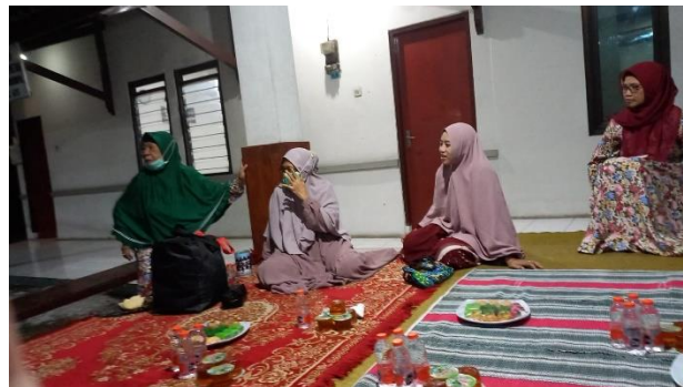
Gambar 1. Edukasi tahap awal – penelusuran pemahaman

Proses observasi yang dilakukan dalam berbagai tahap yang dilaksanakan kegiatan serta wawancara yang dilakukan yang bersumber dari warga sekitar dengan latar belakang ekonomi dan jenjang serta keterbutuhan dukungan dari organisasi masyarakat di lingkungan tersebut. Diketahui bahwa organisasi masyarakat dari lingkungan tersebut terdiri dari ketua, sekertaris, bendahara 1 di lingkup pembangunan serta sejahtera sosial, bendahara 2 di lingkup koperasi simpan pinjam warga, bendahara 3 di lingkup kerohania, keamanan dan lingkungan.