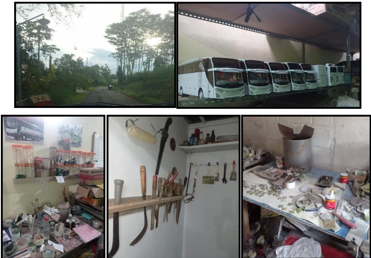
Gambar 3. Tahap Observasi meninjau UMKM Niki Kayoe

Program pengabdian masyarakat diawali dengan pengurusan ijin dan kordinasi dengan pemilik UMKM craft miniatur bis. Dengan pemiliknya bapak Syaiful menyebutkan bahwa adanya permasalahan tentang kurangnya pengetahuan dalam membuat laporan keuangan sehingga sulit untuk menata keuangan UMKM tersebut. Setelah tahap observasi dan pengamatan, kemudian pelaksanaan pelatihan dilaksanakan.