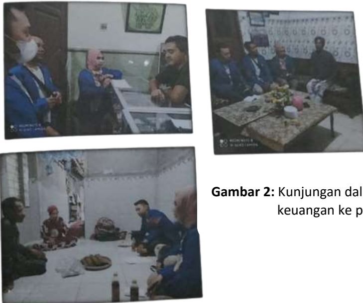
Gambar 2: Kunjungan dalam rangka pendampingan literasi keuangan ke peserta FGD