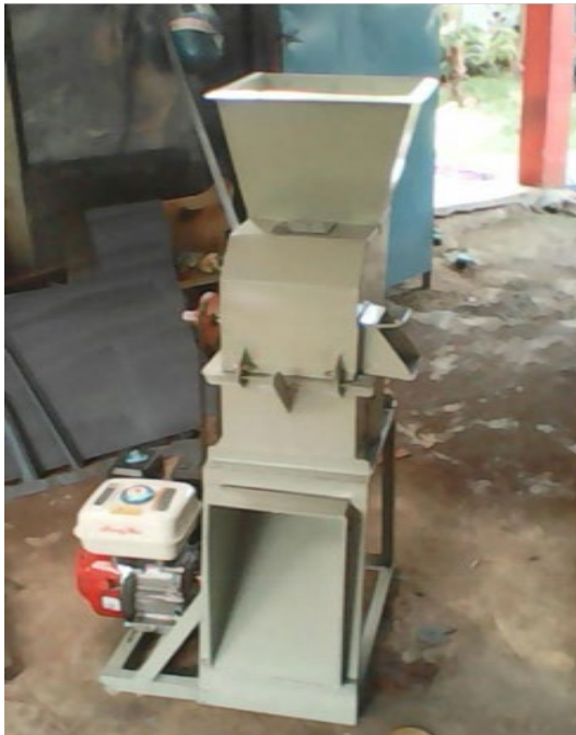
Gambar mesin pencacah pakan ternak serbaguna

Mesin pencacah rumput yang dirancang memiliki dimensi panjang 795 mm, lebar 600 mm, dan tinggi 1.140 mm. Motor bakar (diesel) yang dipakai adalah 5,5 Hp dengan 2.500rpm dan memiliki 2 masukan yaitu dari atas dan samping. Mesin pencacah pakan ternak ini memiliki kapasitas produksi 300 kg/jam.