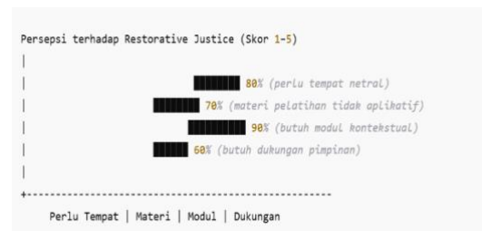
Gambar 1. Persepsi Karyawan Bersertifikat terhadap Efektivitas Restorative Justice (Diagram Batang)